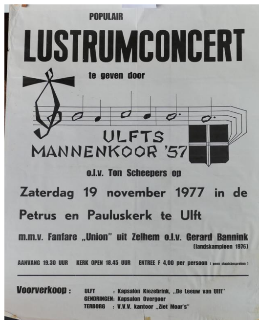
# 91 Poster 1979 Lustrumconcert Ulfts Mannenkoor