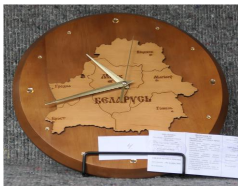
# 4 Wandklok Aandenken aan de Concertreis naar Kamnik Oktober 2009

Zoals eerder aangekondigd, organiseert het bestuur tijdens de feestmiddag een spannende Amerikaanse veiling! Dit is je kans om unieke items te bemachtigen, terwijl je geniet van een gezellige middag vol competitie en plezier. Hieronder vind je alvast een voorproefje van de items die geveild worden. Mis het niet!