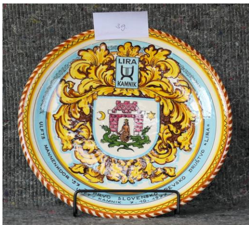
# 39 Handgeschilderd stenen Bord Lira Kamnik 1977